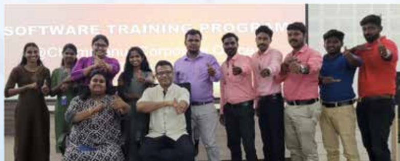
Induction Training No: 38