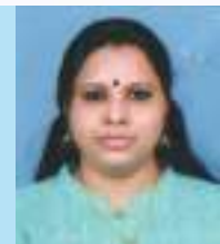
Jisha Executive-Daily Loan