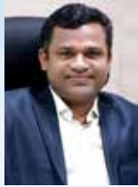
Jisso Baby CMD