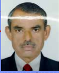
THANKACHAN 21 LAKHS