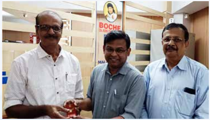
മലകര ക്രെഡിറ്റ് സൊസൈറ്റി 'ഇതാഗസിൻ', പെറ്റൽസ് വാലു 18 ലകരി പ്രോ മതര വിജയി ശ്രീ പ്രമൻസിയസ് മിസിയ സിജിയും പതസൻ വരഗിയരിതരി നിന്നു സുരണ്ണ നരണയം ഏറു വാങ്ങുന്നു. ഡിയുമിനം പ്രമൻസിയസ് ആന്റണി സമീഹം