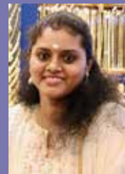
VIMISHNA BC STAFF - THALASSERY