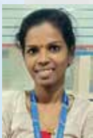
SILPA C M EXECUTIVE TELE CALLING