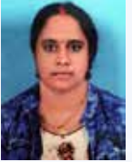
RALIKA PR Senior Executive - Agriculture Hydroponics