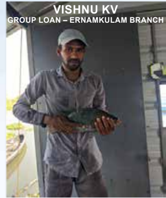
VISHNU KV GROUP LOAN - ERNAMKULAM BRANCH