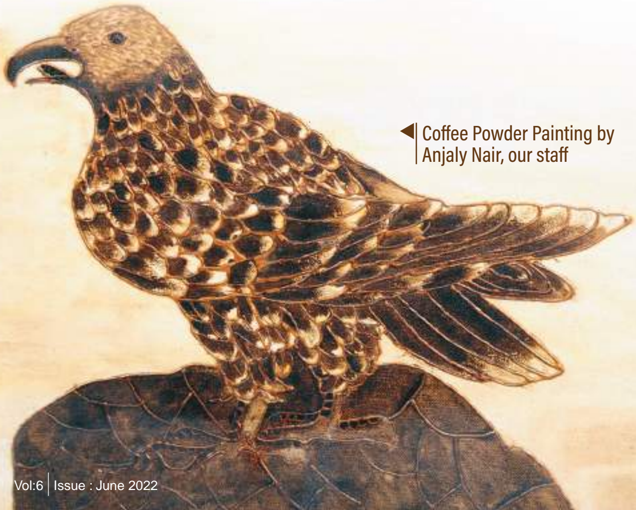
◀ Coffee Powder Painting by Anjaly Nair, our staff