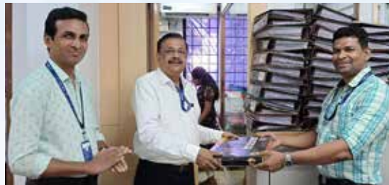
GIFT WAS ACCEPTED BY VIVIN