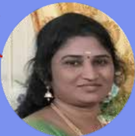
SARITHA 10 LAKHS