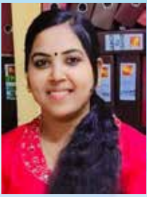
LISNA ASST. MANAGER CREDIT