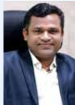
JISSO BABY CHAIRMAN

T O Instil a sense of belonging and involvement Appreciate and upload the achievements Act as a communication medium Increase the professional competence