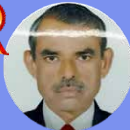
THANKACHEN P 6.5 LAKHS