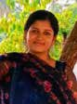
Amritha Operations Executive