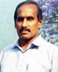
SUNDARAN 10 LAKHS