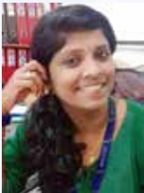
Suja MS Executive-Telecalling