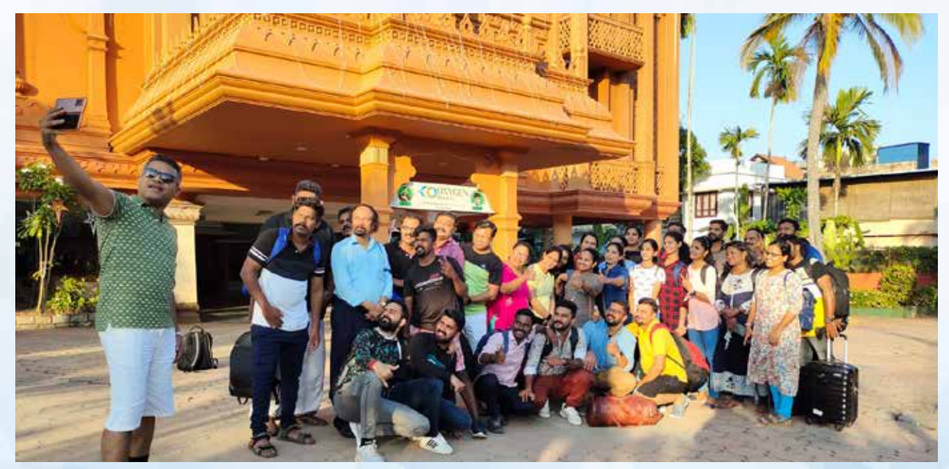
A O staff trip to Club Oxygen Resorts, Alleppey