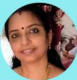
BIJIDAS 10 LAKHS