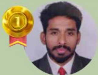
MITHEESH 12.50 LAKHS