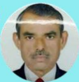
THANKACHAN 2.85 LAKHS