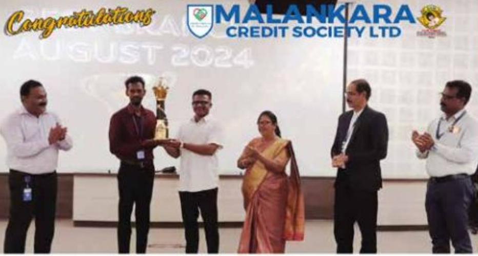
CHAIRMAN'S EVER ROLLING TROPHY BEST BRANCH AUGUST 2024 IRINJALAKUDA