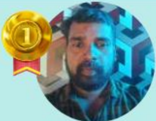
VINESH C.V 20.68 LAKHS