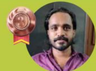
RAMADAS 8.05 LAKHS