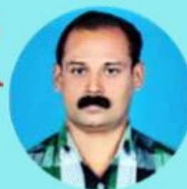
SUNNY TC 5 LAKHS