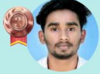
AMAL 19.12 LAKHS