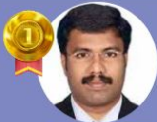
K K SAJEESH 9.60 LAKHS