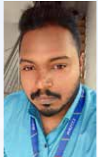
ARJUN KA CREDIT OFFICER NORTH PARAVOOR