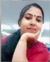
LISNA ASST. MANAGER, GOLD LOAN