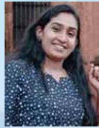
AISWARYA Executive - Customer Relations