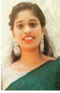
SOLJA CUSTOMER RELATIONSHIP EXECUTIVE

The days has gone.... My Minds holding on Sour Memories I go in Silence of darkness And I Scream In my Mind And I shut My eyes... No glimpse of light. Then, the Another day has gone... I struggle to live I'll give this Misery. I breathe I rather take My all pains