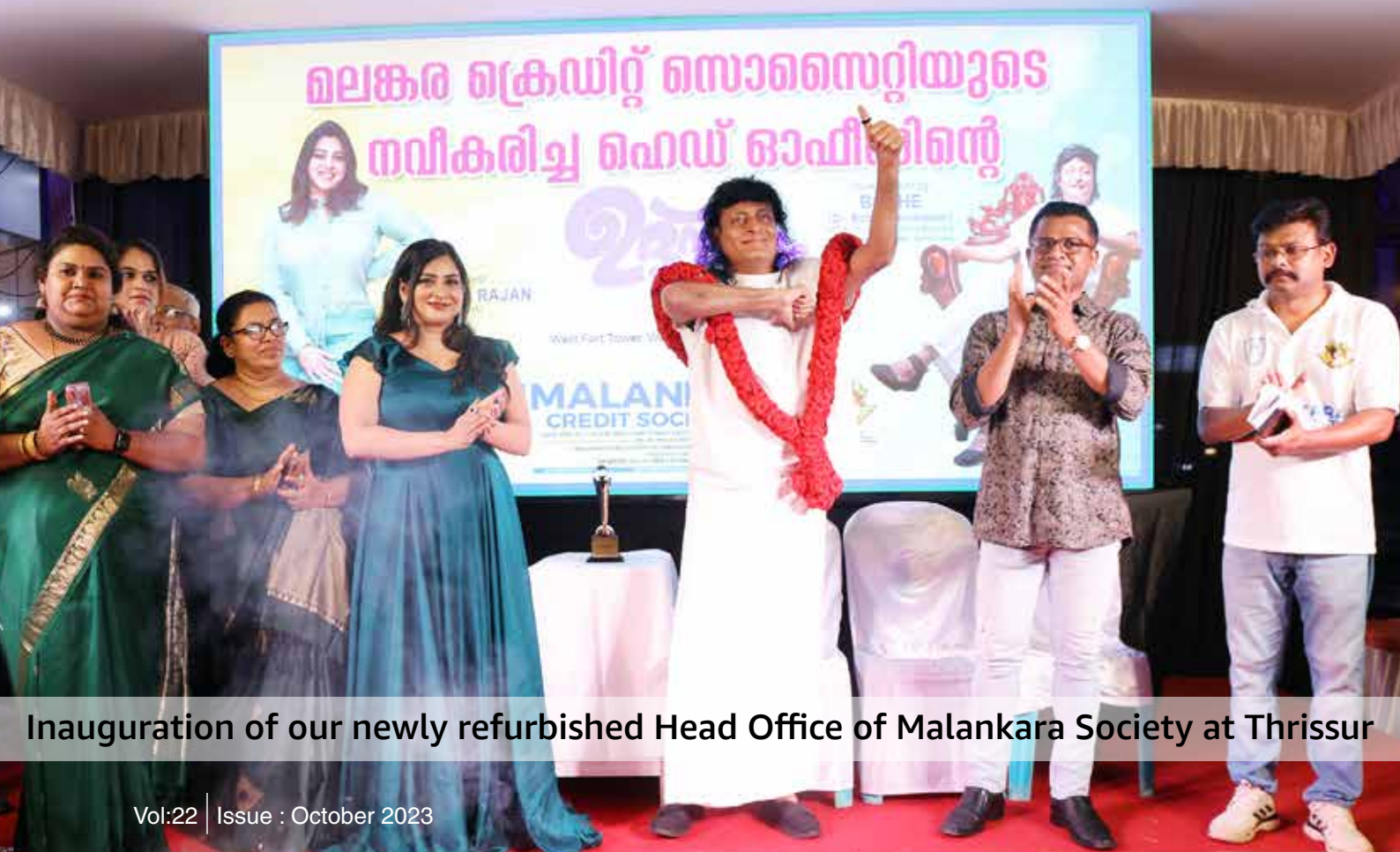
Inauguration of our newly refurbished Head Office of Malankara Society at Thrissur