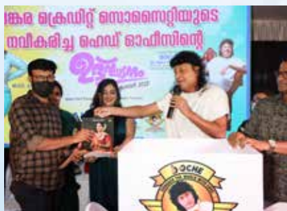
ഉദ്ഘാടനത്തിന് എത്തിയവരിൽ നിന്നും നിരക്കടപ്പിലൂടെ ഗോൾഡ് കോയിനു അർഹയവർ