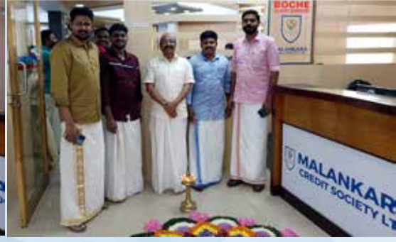
Onam2022 at Head Office