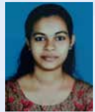
SWETHA Executive - Vehicle Loan