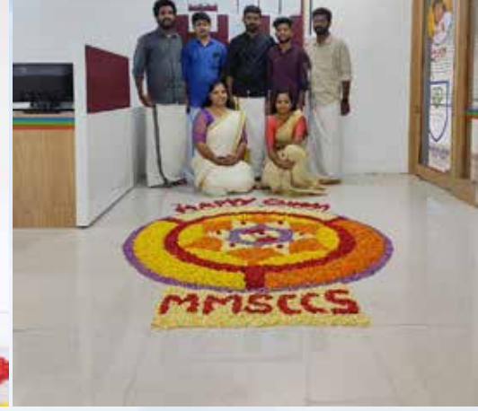
Onam2022 at Vadakkenchery CFC