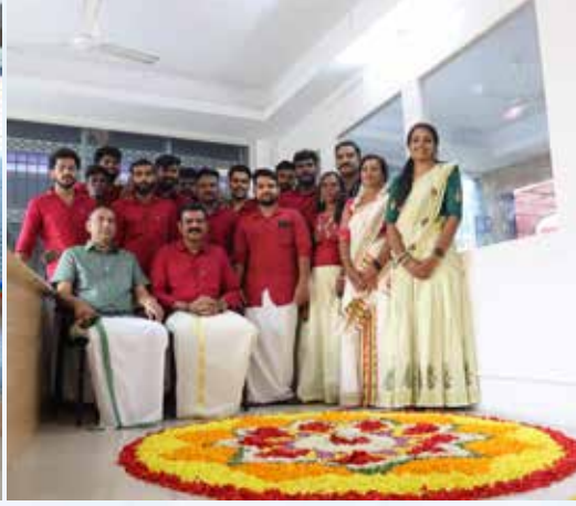
Onam2022 at Trivandrum Branch