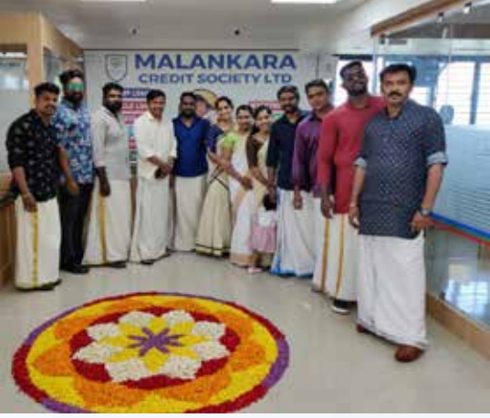
Onam2022 at Ernakulam Branch