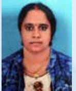
RALIKA PR Senior Executive - Agriculture Hydroponics

ന മ്മുടെ നാടൻ കൃഷിരീതിയിൽ നമുക്ക് ഉണ്ടാകാറുള്ള ബുദ്ധിമുട്ടുകൾ മനസ്സിലാക്കി തികച്ചും സാങ്കേതികമായി തയ്യാറാക്കിയിട്ടുള്ള ഒരു കൃഷിരീതിയാണ് Hydroponic Farming. മണ്ണ് ആവശ്യവും ഇല്ല എന്നുള്ളതാണ് ഇതിന്റെ ഏറ്റവും വലിയ സവിശേഷത. കൂടാതെ അന്യസംസ്ഥാനങ്ങളിൽ നിന്നും വരുന്ന വിഷം അടിച്ച പച്ചക്കറികൾ കഴിക്കുന്നതുമൂലം നമുക്കും നമ്മുടെ കുടുംബത്തിനും നമ്മുടെ കുട്ടികൾക്കും ഉണ്ടാകാവുന്ന ശാരീരിക പ്രശ്നങ്ങളിൽ നിന്നും ഒരു മോചനം കൂടിയാണ് ഈ സാങ്കേതികവിദ്യ. ശുദ്ധവും പോഷകഗുണവും ഉള്ളതായ ജൈവ പച്ചക്കറികൾ കയ്യിൽ ചെളി ആവാതെ നമ്മുടെ വീട്ടുമുറ്റത്ത് ലഭിക്കുന്നു. ഇന്ന് പറമ്പിൽ കിളക്കുവാനും മറ്റും ബുദ്ധിമുട്ടുകൾ ഉള്ളപ്പോൾ Hydroponic Farming ലൂടെ എത്ര പ്രായമായവർക്കും കുട്ടികൾക്കും അനായാസേനെ കൃഷി ചെയ്യാൻ സാധിക്കുന്നു. മട്ടുപാവിടല ഒരു ചെറിയ പച്ചക്കറിത്തോട്ടം എല്ലാ വീട്ടമ്മമാരുടെയും സ്വപ്നമാണ്. അതിലേക്കുള്ള ഏറ്റവും ലളിതവും എന്നാൽ ഗുണമുള്ളതുമായ ഒരു കൃഷി രീതിയാണിത്. ഇന്ന് ലോകമെമ്പാടും ഉള്ളവർ Hydroponics കൃഷി രീതി ചെയ്തുവരുന്നു.