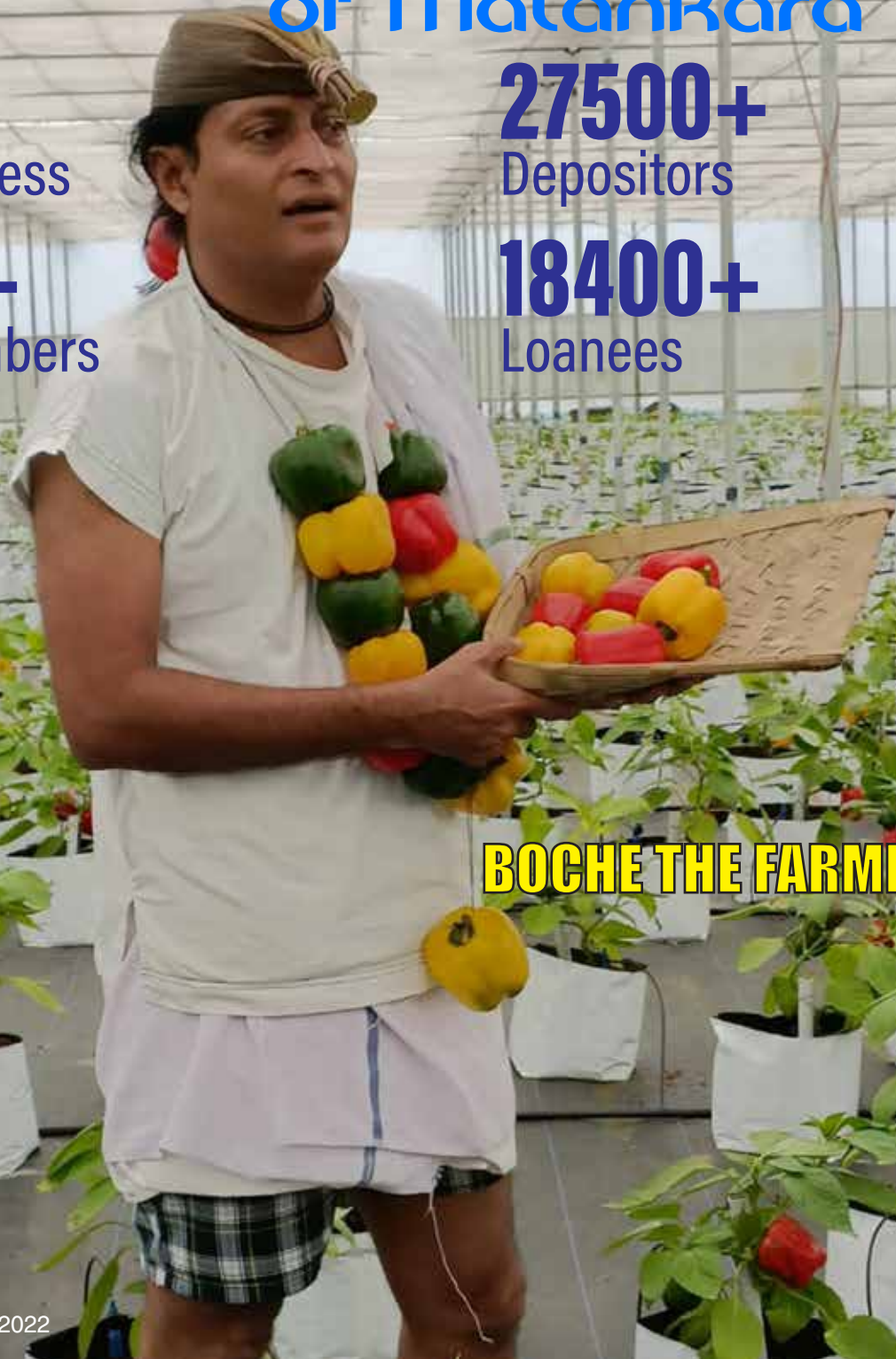
BOCHE THE FARMER