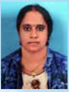
RALIKA PR Senior Executive - Agriculture Hydroponics