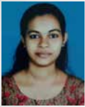
SWETHA Executive - Vehicle Loan