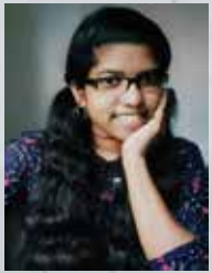
ശ്രീമ.ഓരുദ Operation Executive

അകമേ തണുത്തൊരൻ നെഞ്ചമതിന്നറിയാതെ, പെയ്തു തിരിർത്തു നീ ആനോളം ഭൂമിയിൽ പകലിലെ ചൂടിന്, ഓറി നിൻ വരവിലായ് ദേഹം വിറച്ചിന് നിൻ നേർത്ത കളിരിനാൽ തൊട്ടൊന്നറിയാനായ് കൈ കൈയ്ക്കു നീട്ടി ഞാൻ, ശക്തിയായ് ചുംബിച്ചു നീയെൻ വിരൽ തുമ്പിലായ് ഒടിചൊന്നു നിന്നെന്നെ കൈയ്ക്കു തഴുകി നീ നന്നത്തൊരു ദേഹമെൻ, നീയെന്ന പെണ്ണിലായ് എന്നെ ഹന്നിതാ കളിതം ഹന്നിതാ നെഞ്ചം പിടഞ്ഞിതാ നീയെന്ന ഹോഹായ് തുള്ളിയായ് പെയ്തു നിൻ, നേർത്ത ചൂടു ചുംബനം ഷഴയായ് കൈയ്ക്കിന്നൊഴുകിടുന്നോൾ.. ആഴിയിൽ ചേരമ്പൻ ഹോഹിച്ചു നദിയെപ്പോൽ നിന്നെ നന്നയാനായി ഹന്നിതാ ഇന്നെന്നെ ഞാൻ..