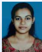
SWETHA Executive - Vehicle Loan