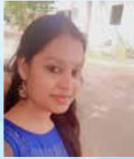
SABNA Executive Daily Loan