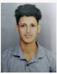
VISHNU VS Civil Engineer