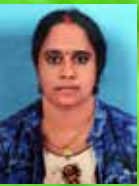
RALIKA PR Senior Executive - Agriculture Hydroponics