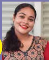
Anupama CP CRE Liability