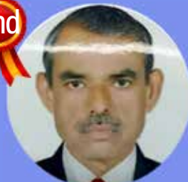
THANKACHAN 5 LAKHS