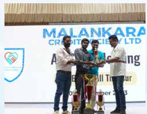
BEST GROUP LOAN UDUMALPET CFC