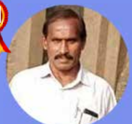
SUNDARAN 3 LAKHS