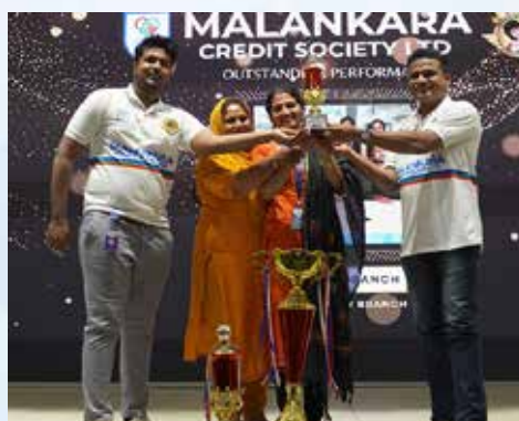
BEST LIABILITY BRANCH THRISSUR