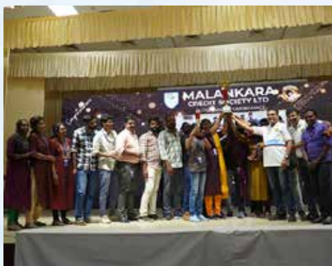
BEST BRANCH & BEST GOLD LOAN BRANCH TRIVANDRUM