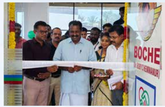
ബാലരാമപുരം കസ്റ്റമർ ഫെസിലിറ്റേഷൻ സെന്റർ ഉദ്ഘാടനം കോവളം എംഎൽഎ ശ്രീ. എം വിൻസെന്റ് നിർവഹിച്ചു.