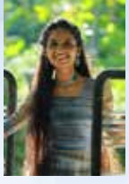
ANJANA EXECUTIVE VEHICLE LOAN