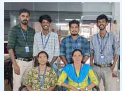
Top Sales branch October - Group Loan Punalur CFC Sales volume - 73.73 Lakhs Achievement - 147%