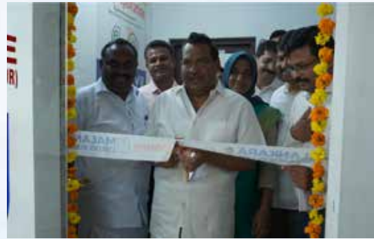
മഞ്ചേരി കസ്റ്റമർ ഫെസിലിറ്റേഷൻ സെന്റർ ഉദ്ഘാടനം മഞ്ചേരി എംഎൽഎ ശ്രീ. യു.എ ലതീഫ് നിർവഹിച്ചു.