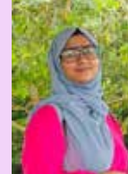
Fazeelath V W/O Mansoor AG CM Auditing