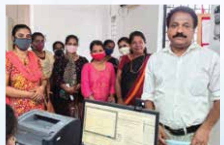
1 st Group Loan Disbursement-EKM Br.