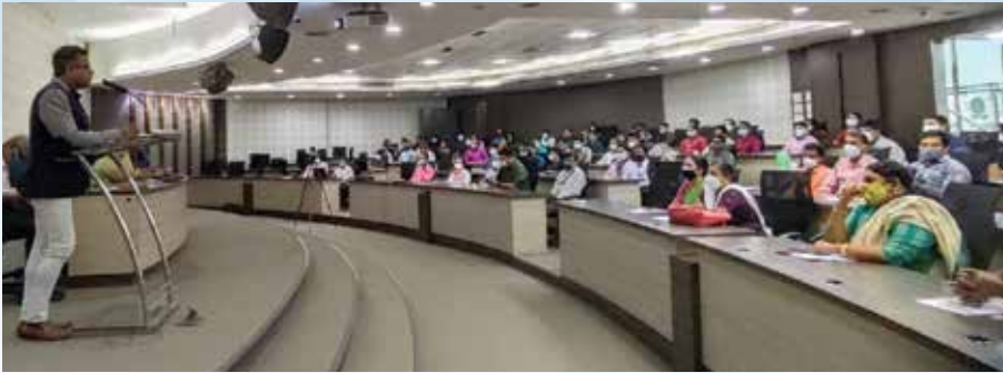
Annual General Meeting