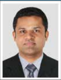
JISSO C BABY Chairman & Managing Director