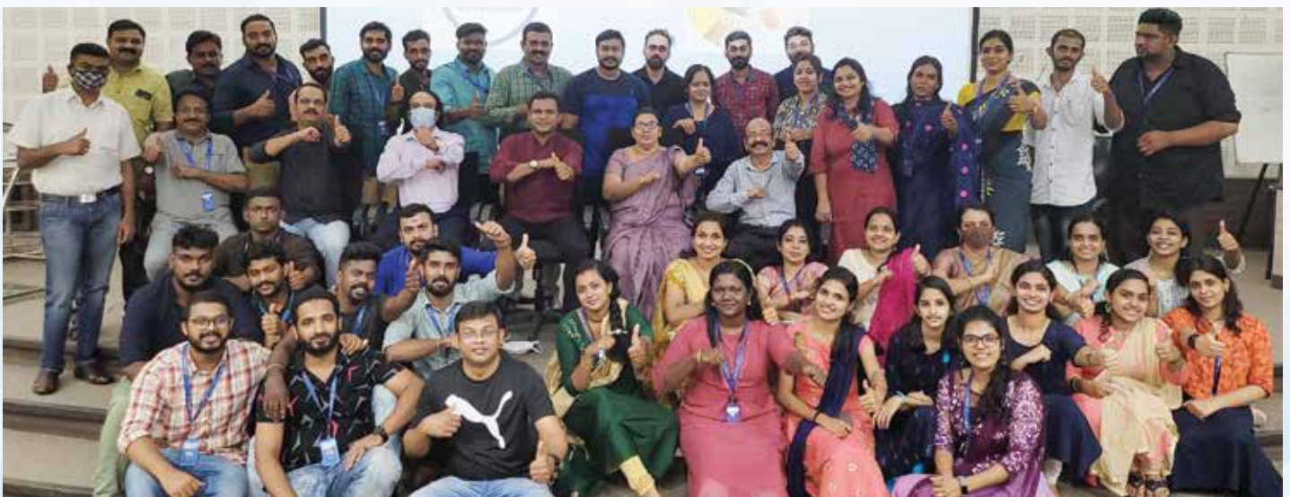
All Staff Induction Training