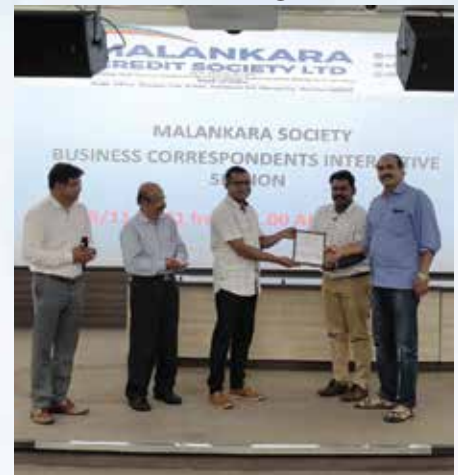
Business Correspondents Meet