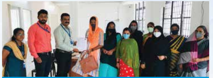
1 st Group Loan Disbursement-TVM Br.