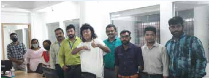
Dr. Bobby Chemmanur visited TVM Branch