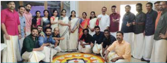
Onam Celebration A O Thrissur