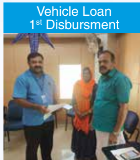
Vehicle Loan 1 st Disbursement