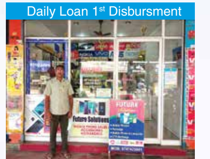
Daily Loan 1 st Disbursement