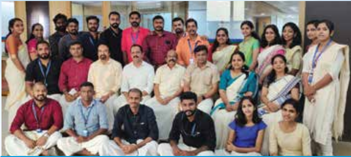
Kerala Day Celebration