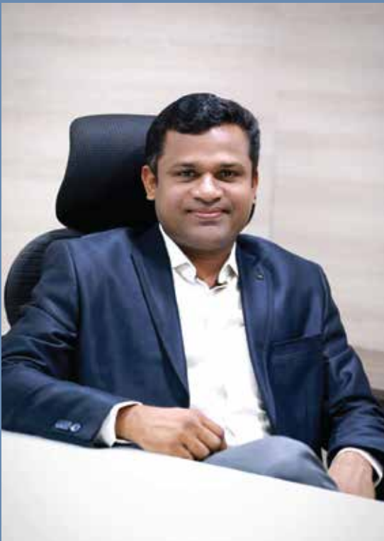
Jisso Baby Chairman and Managing Director

കേ ന്ദ്ര സർക്കാരിന്റെ സഹകരണ വകുപ്പിന്റെ കീഴിൽ പ്രവർത്തിക്കുന്ന ഒരു മൾട്ടി സ്റ്റേറ്റ് ക്രെഡിറ്റ് സൊസൈറ്റിയാണ് നമ്മുടെ സ്ഥാപനം എന്നറിയാമല്ലോ. ഉയർച്ചയുടെ പടവുകൾ ഒന്നാന്നായി ചവിട്ടിക്കയറുന്ന നമ്മൾ ഒരു ബാങ്കിങ് സ്ഥാപനമായി ഉയർത്താനാണല്ലോ പരിശ്രമിക്കുന്നത്. നിങ്ങളുടെ ഏവരുടെയും സഹായ സഹകരണം അഭ്യർത്ഥിക്കുന്നു. സഹകാരികളുടെ ഉന്നമനത്തിനായി അവർക്കു ഉതകുന്ന നിക്ഷേപ പദ്ധതികൾ വഴി നാം ഉയർന്ന പലിശയും, ലാഭ വിഹിതവും നൽകുന്നുല്ലോ. അതുപോലെ തന്നെ എല്ലാവർക്കും ഉതകുന്ന വായ്പാ പദ്ധതികളും നമുക്കുണ്ട്. നമ്മുടെ ശാഖകൾ ഒരു നവീന കോർ ബാങ്കിങ് സോഫ്റ്റ്‌വെയർ വഴി ബന്ധിപ്പിച്ചിരിക്കുന്നതിലൂടെ എല്ലാ ഉല്പന്നങ്ങളും സമയ ബന്ധിതമായി വിതരണം ചെയ്യാൻ നാം കെൽപുള്ളവർ ആണ്. അടുത്ത വർഷം നമ്മുടെ പ്രവർത്തനമണ്ഡലം തമിഴ്നാട്ടിലേക്കും കർണാടകയിലേക്കും നാം വ്യാപിപ്പിക്കും. അങ്ങനെ നമ്മുടെ ഒരംശം നമ്മുടെ സഹകാരികളിലേക്കു എത്തിക്കുവാൻ നാം പ്രതിജ്ഞാബദ്ധരാണ്.